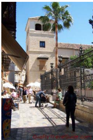
Museo Municipal y casa natal de Picasso

Visita guiada del Ayuntamiento de Málaga MUSEOS